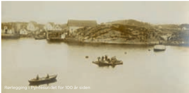
Rørlegging i Pyntesundet for 100 år siden