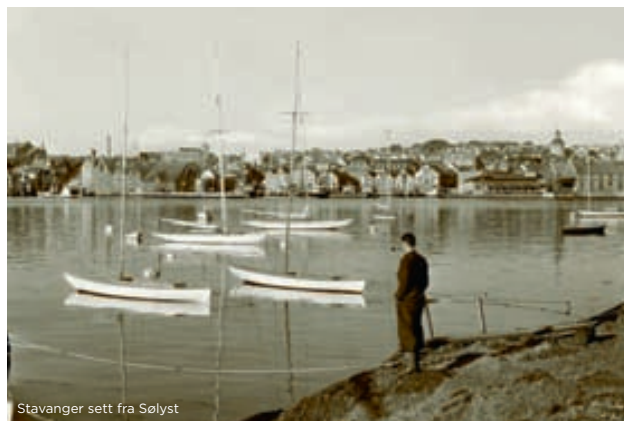
Stavanger sett fra Sølyst