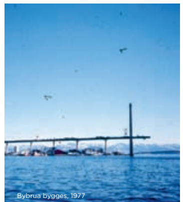
Bybrua bygges, 1977