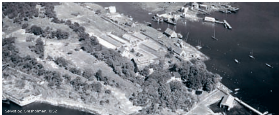
Sølyst og Grasholmen, 1952