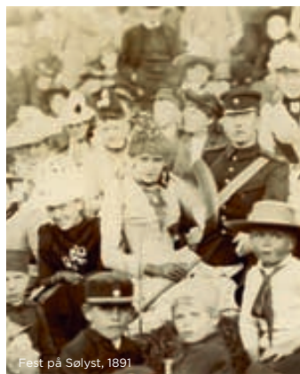
Fest på Sølyst, 1891