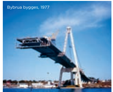
Bybrua bygges, 1977