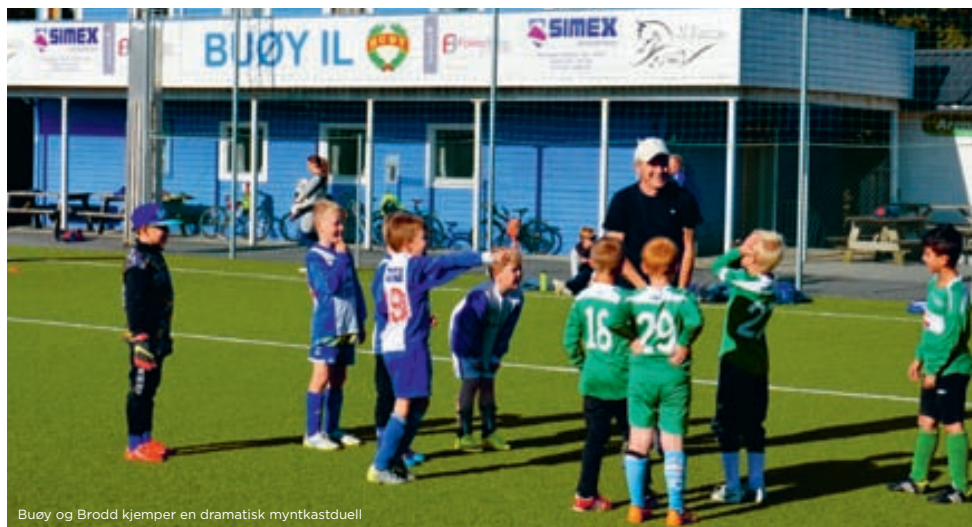
Buøy og Brodd kjemper en dramatisk myntkastduell